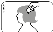
Slika. Češljanje mokre kose češljem za uši od tjemena do vrhova